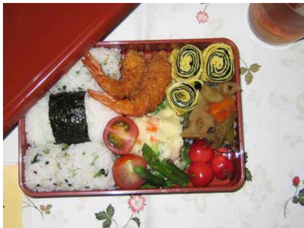
図1 地場産品使用の弁当設計図